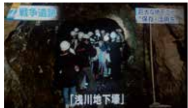
8月の見学会の様子NHKテレビのニュース画面より

八王子市内に残る戦争遺跡・浅川地下壕の壕内見学です。浅川地下壕は戦争末期、飛行機のエンジンをつくる工場として使われた大規模な地下トンネルです。見学会は10月以降も、月に1回の予定で開かれますが、参加するには事前申し込みが必要です。見学申し込み・お問い合わせは、sptf2z99@ion.ocn.ne.jpのアドレスにメールをお願いします。